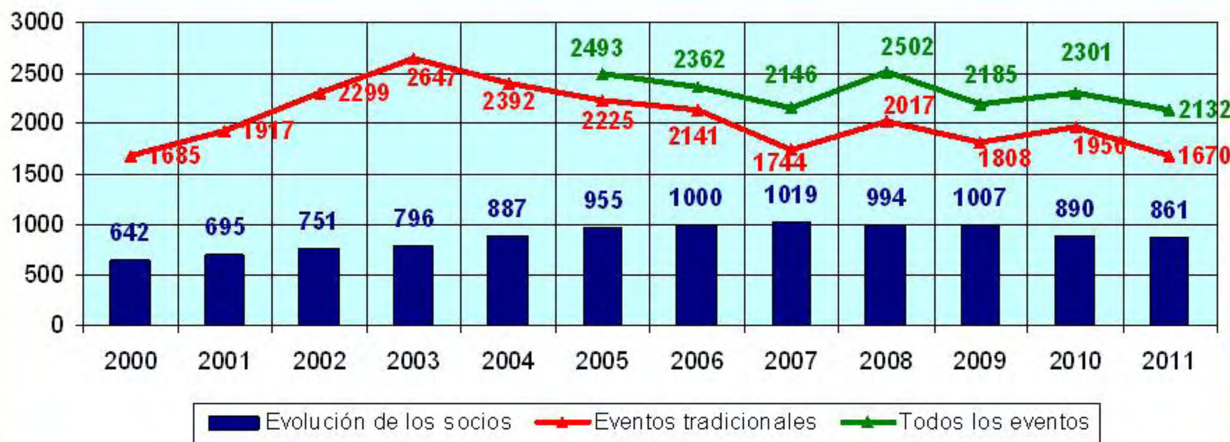
Concurrencia a eventos y evolución de los socios