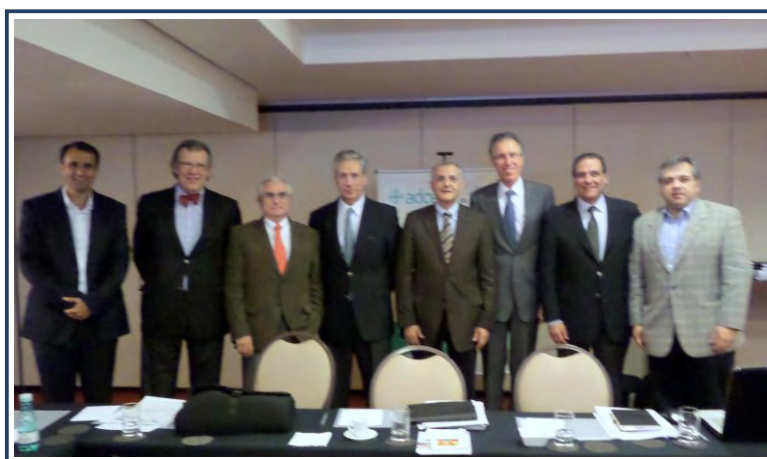
Comité Consultivo, de Izq a Der: