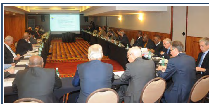
En plena Reunión