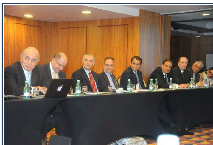
Participantes latinoamericanos escuchan atentamente