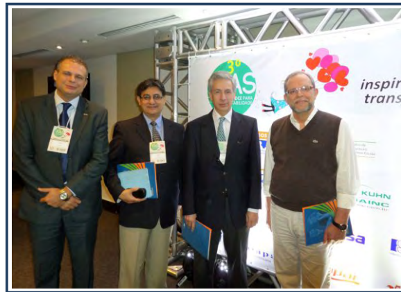
Participantes, expositores y colaboradores del FAS